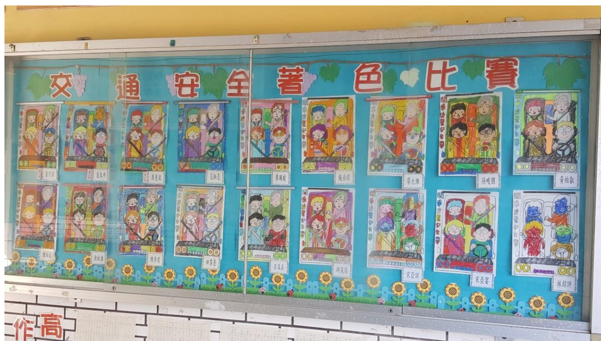
低年級交通安全著色比賽成果公佈