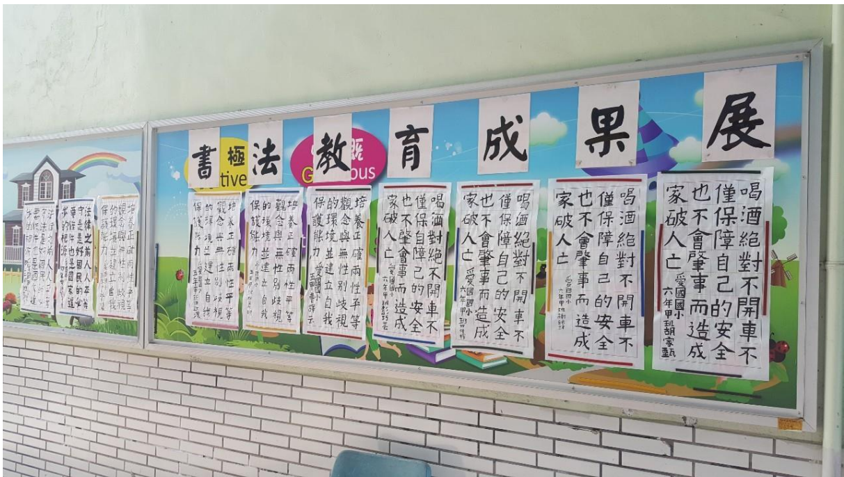
中年級交通安全繪畫比賽成果公佈