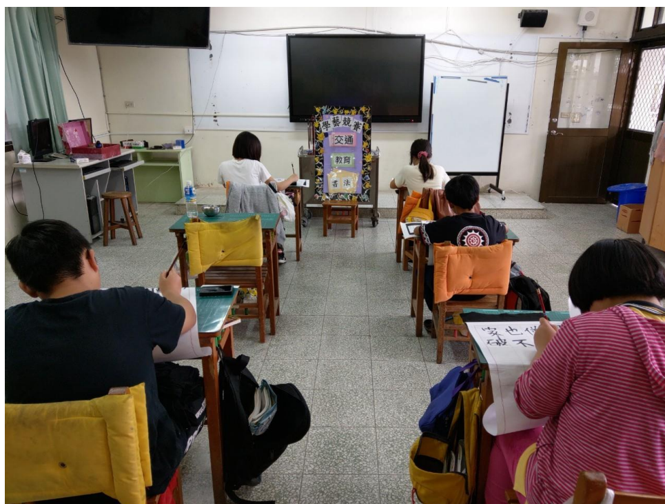
中年級交通安全繪畫比賽成果公佈