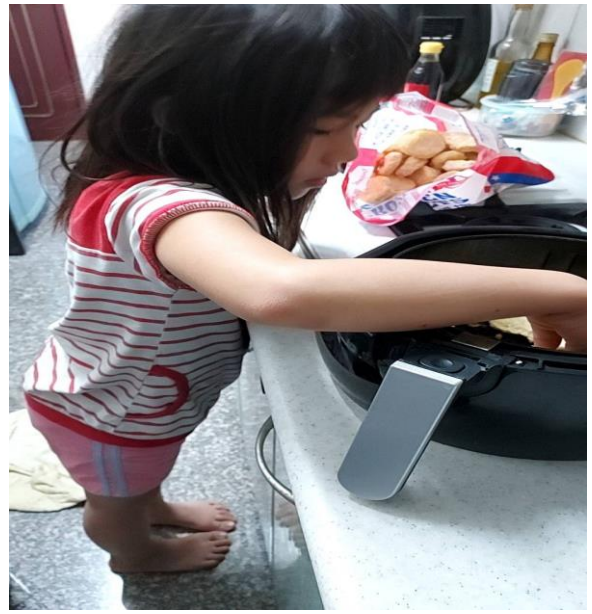
學習使用家電為家人製作餐點