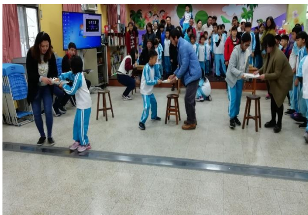
親子同心協力過關卡