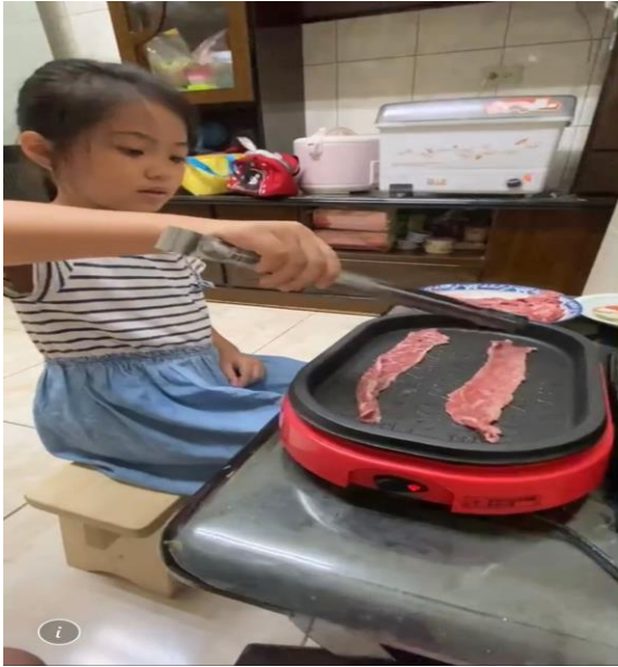
學生練習烹煮食材