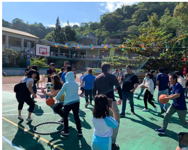
家長及小朋友一同開心的玩