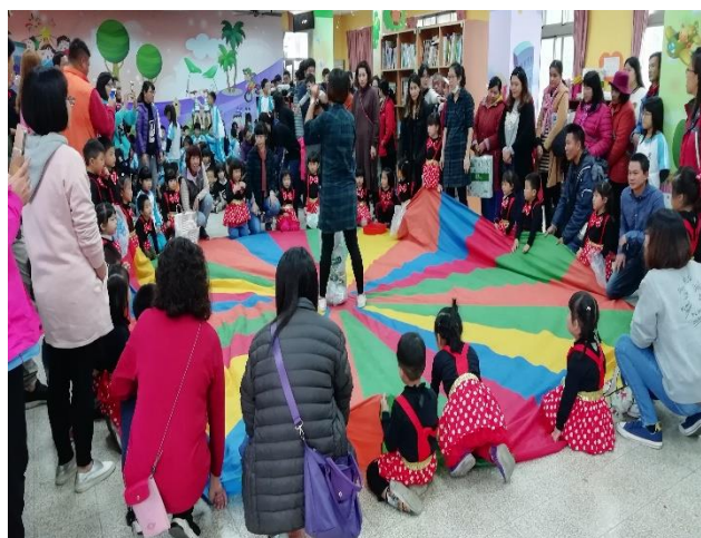
親子同心協力過關卡