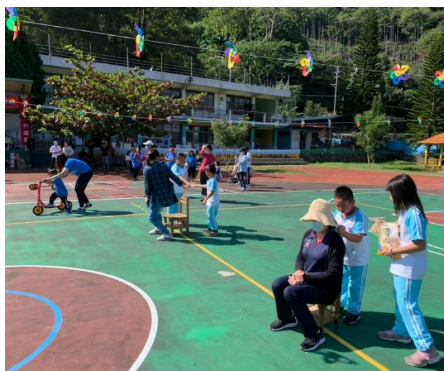
家長及小朋友一同開心的玩