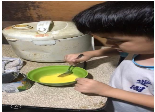
學生練習烹煮食材