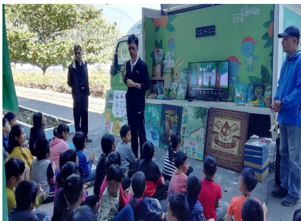
愛家必先學會愛護環境及防災避災