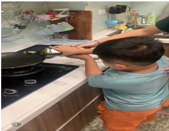
學生練習烹煮食材