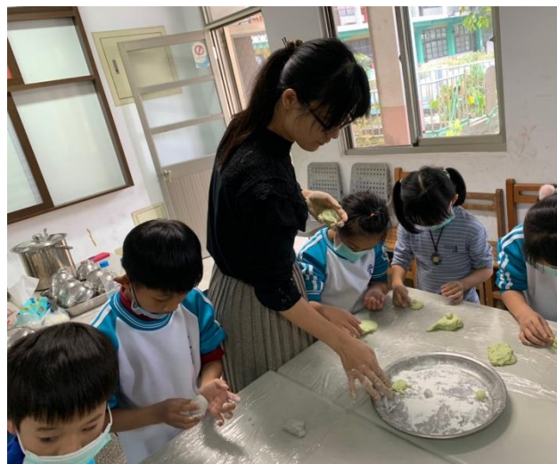
老師指導學生如何包湯圓