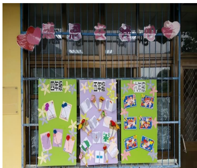
教師指導學生製作母親卡 感謝母親的 辛苦