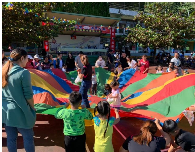
家長及小朋友一同開心的玩