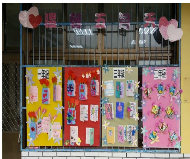
教師指導學生製作母親卡 感謝母親的 辛苦