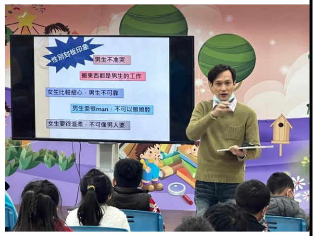
性平教育讓孩子有正確的性別觀念