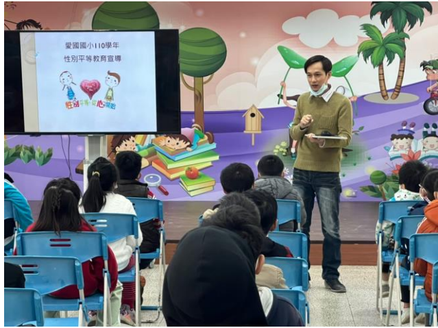
性平教育讓孩子有正確的性別觀念