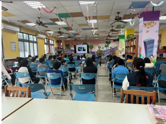
性平教育讓孩子有正確的性別觀念