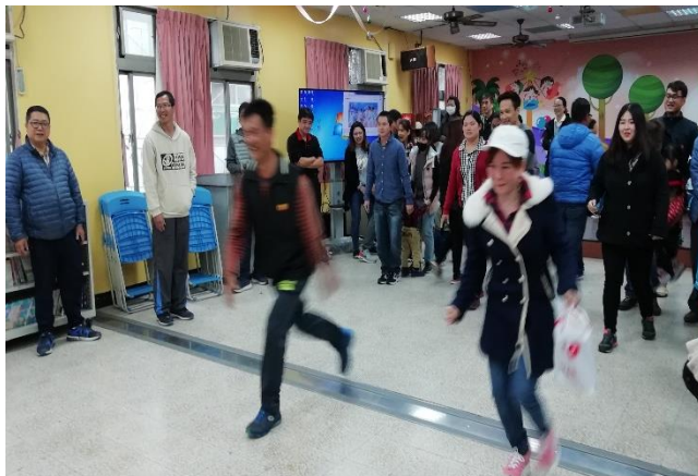
親子同心協力過關卡