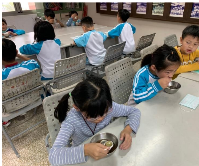
自己做的湯圓最好吃了