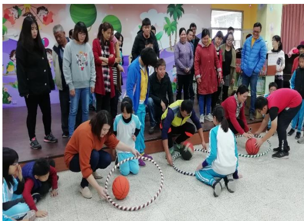
親子一起來運動 增進感情