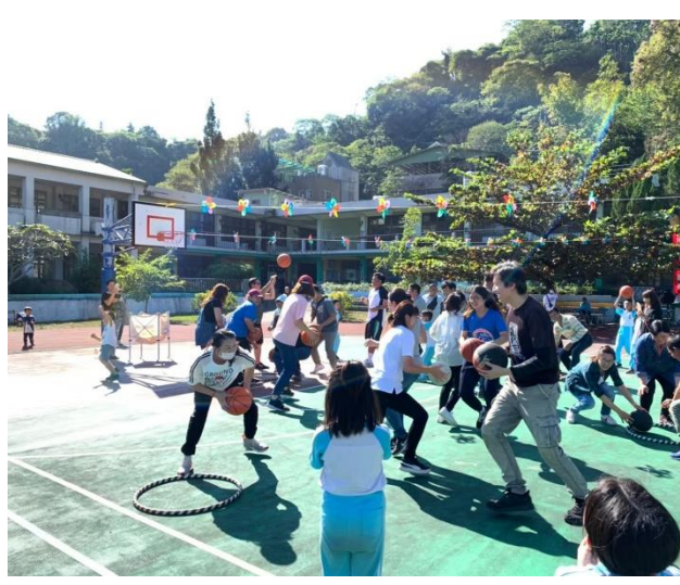
家長及小朋友一同開心的玩