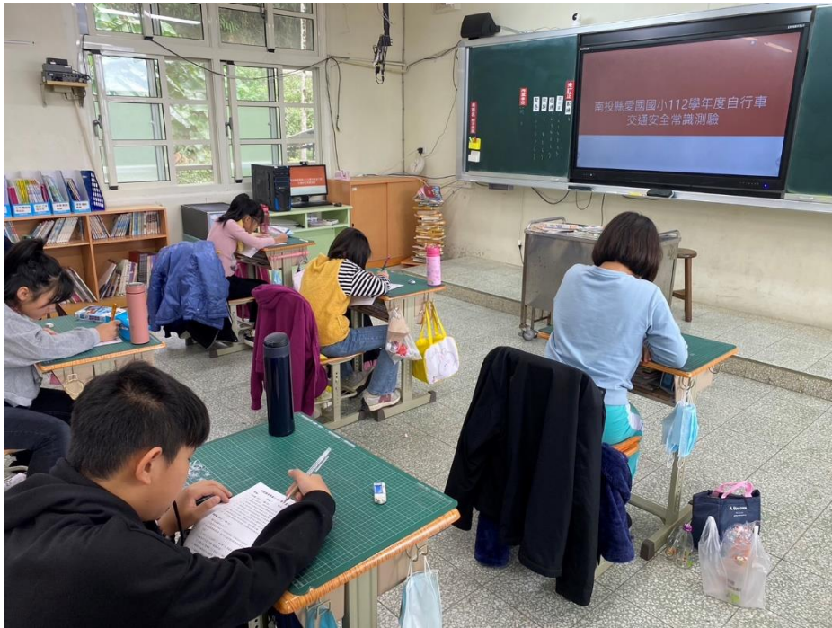
說明：五甲進行自行車常識測驗