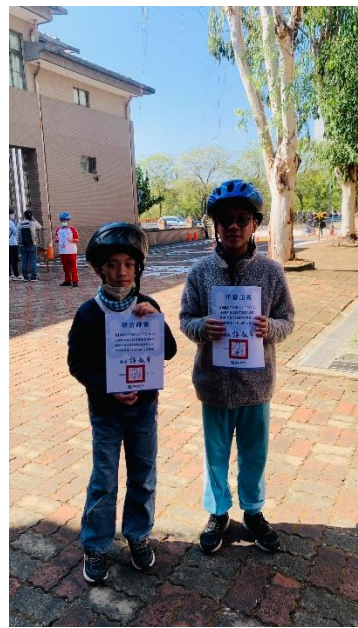
本校六甲學生參加自行車考照活動。