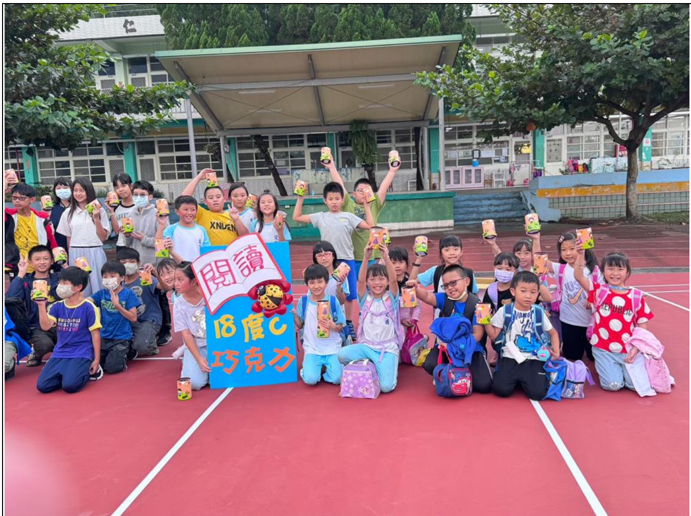
熊愛閱讀達標學生皆獲 18 度 C 工房之罐裝巧克力獎品