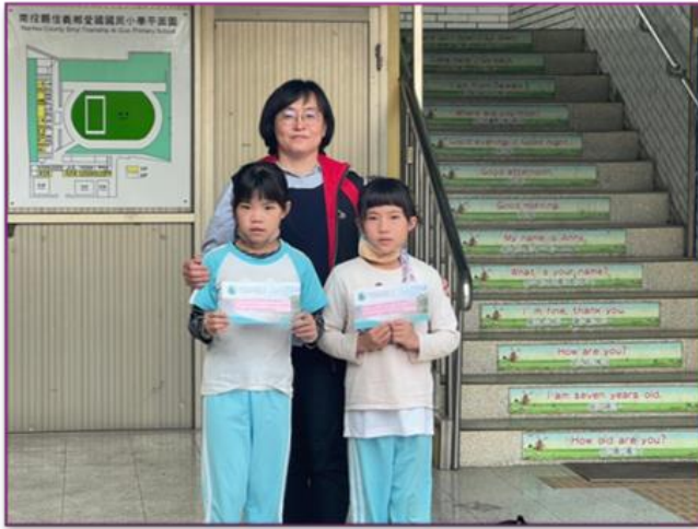
代代傳說-母語及本土語小主播比賽頒獎