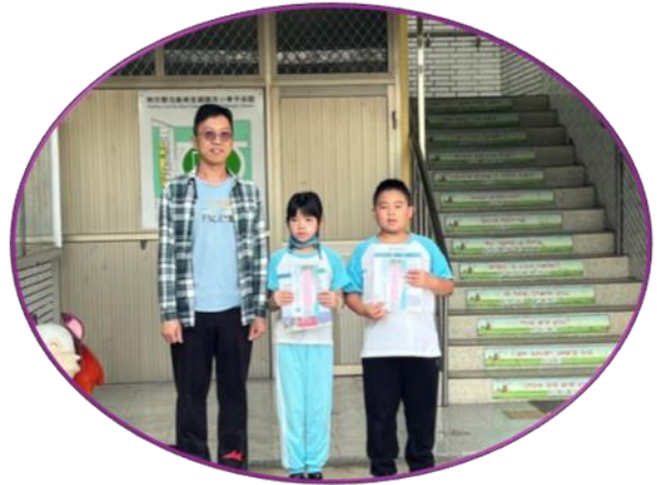
代代傳說-母語及本土語小主播比賽頒獎