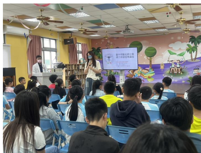
每位小朋友都認真聽講