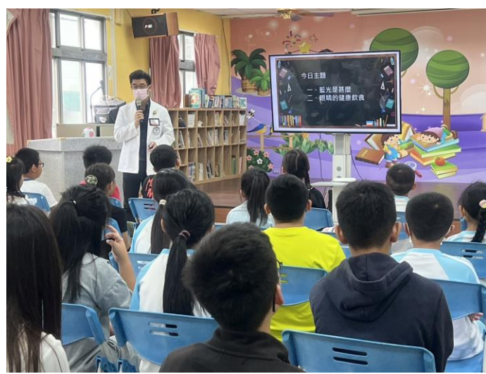
驗光師到校為小朋友講視力保健的重要性