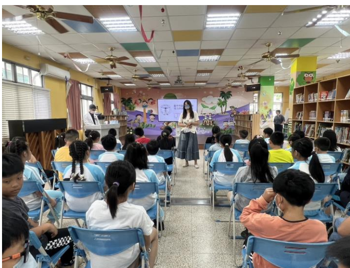
家庭健康從做好自身視力保健開始