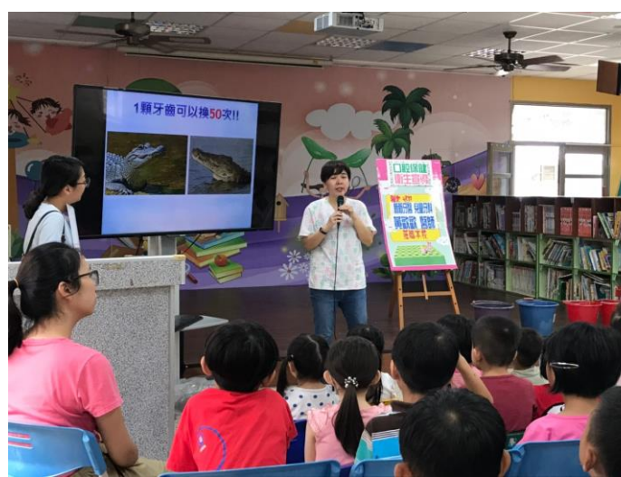
牙醫到校為小朋友解說