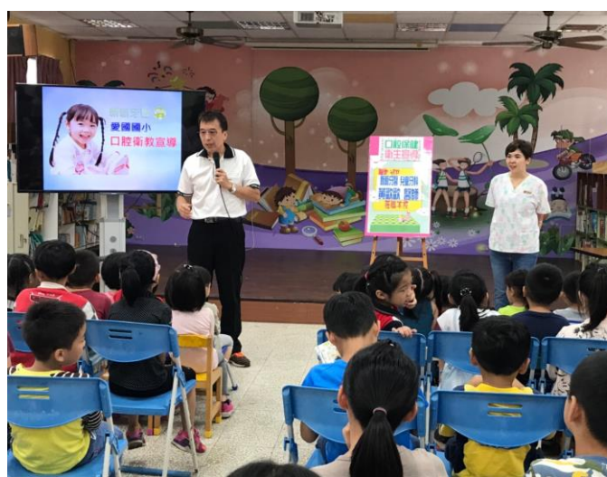
校長講解口腔衛生的重要