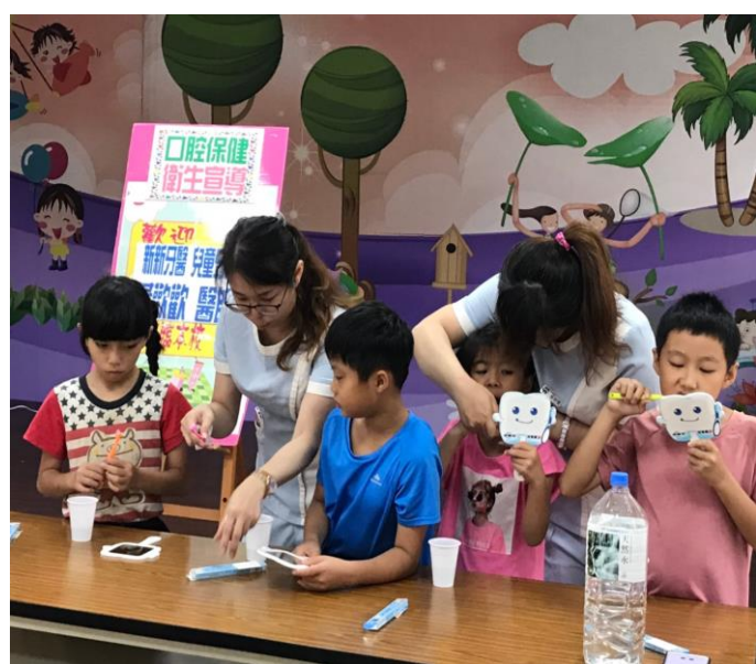
家庭健康從做好自身口腔衛生開始