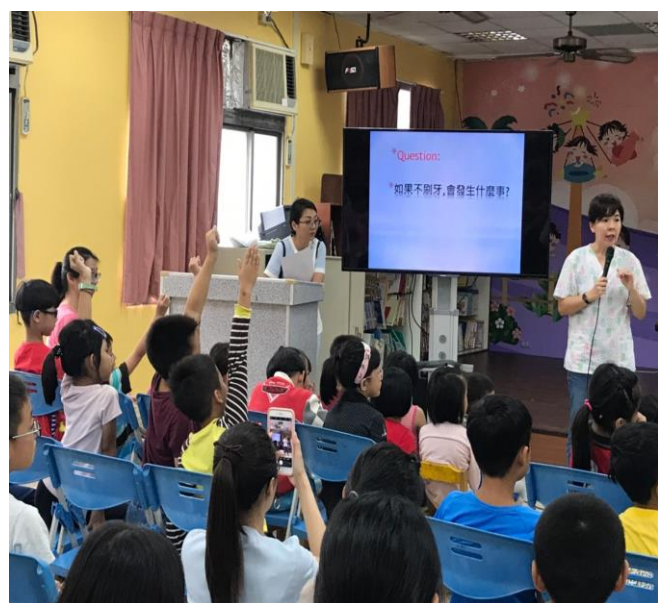
小朋友認真聽講 熱烈搶答