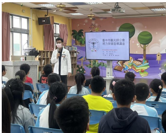
驗光師到校為小朋友講視力保健的重要性